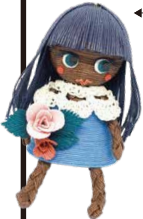
名前 クミン 出身 アメリカ

全て紙で作られている、ぽっこりでおでこがなんともかわいいお人形。 専用の頭ベースに紙バンドを巻いて作ることができます。 肌の色や髪の色など自分好みのお人形を作ってみてください。 様々な表現をすることで、発想も考え方も豊かになれるはず。 バックに付けて一緒にお出かけもできるし、お揃いのバッグを作ってみたり。 あなたの世界を紙バンドールで表現してくださいね。