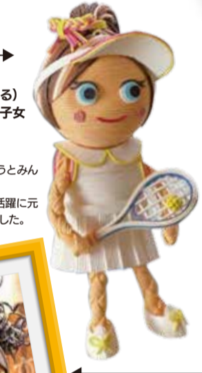
名前 バナナ 出身 フランス

チャームポイント いつも笑っている。山椒が、笑うとみんなも笑顔に! コロナ禍でのスポーツ選手の活躍に元気をもらっているの制作しました。