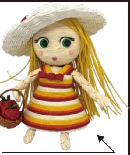
名前 シナモン 出身 ノルウェー

豊かな自然に恵まれた土地で育ち、自然を愛する優しい女の子。自然の中で、どう楽しんでいこうか考えるってワクワク!お料理が好きで、アップルパイを焼くのが好き。お気に入り、帽子。自分にぴったりなサイズを手作り。真っ白の帽子でどこへもお出かけします。りんごを入れるかごもお気に入りです。